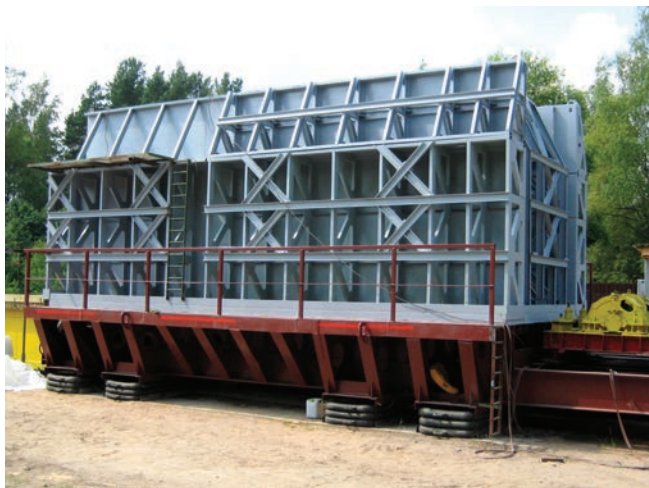
Универсальная сейсмоплатформа УСП-300: общий вид

Ниже приведены фотографии стендов с установленным оборудованием при испытаниях.