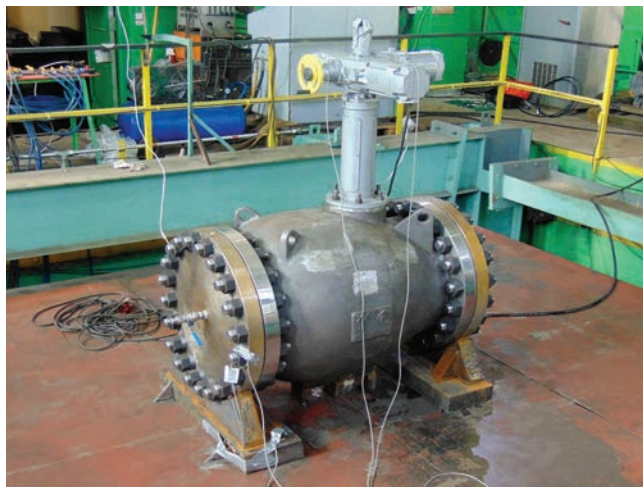
Сейсмоплатформа «УСВС-100»: испытание на сейсмостойкость клапана запорно-регулирующего

ООО «Центр Комплексно-Сейсмических Испытаний» 188820, Ленинградская обл., Выборгский р-н, пос. Роцино, ул. Железнодорожная, д. 10, лит. А тел. (812) 640-73-74, e-mail: info@centercst.ru www.centercst.ru