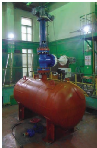
Сейсмоплатформа «УСВС-100»: испытания на сейсмостойкость вантуза нефтепровода (слева) и задвижки DN300 (справа)