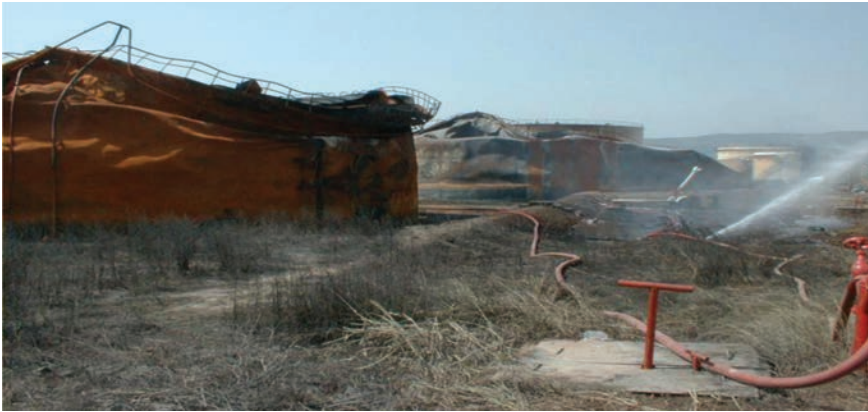
1999 г. Измитское землетрясение ( M=7.4 ), Турция, вызвало пожар и затем разрушение резервуаров (перерабатывающий завод в Yarımtca)