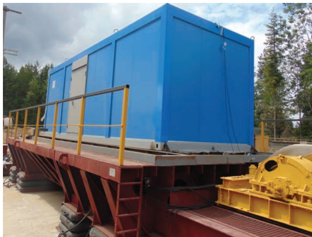
Универсальная сейсмоплатформа УСП-300: испытание на сейсмостойкость блок-контейнера технологического