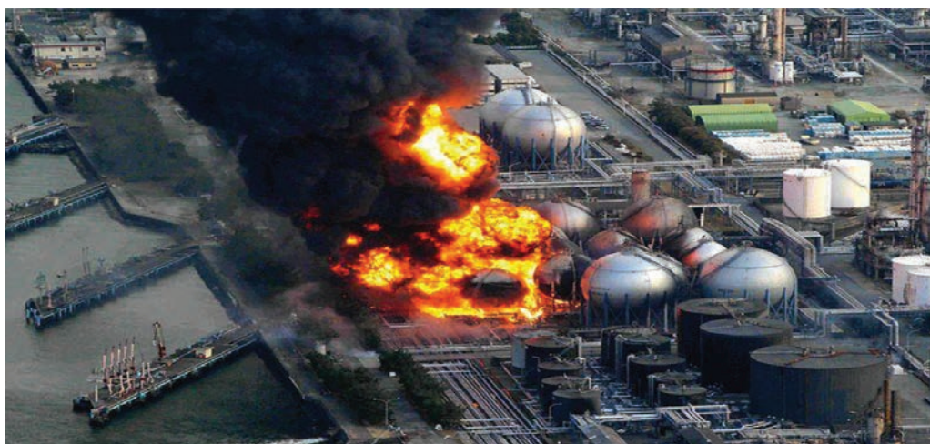
Горящие цистерны с природным газом на заводе Космо в Ичихаре.

Информация об авариях, происшедших за последние 25 лет на емкостях с нефтепродуктами на территории России и за рубежом показывает, что основными формами разрушения вертикальных цилиндрических резервуаров, в результате сейсмического толчка являются: