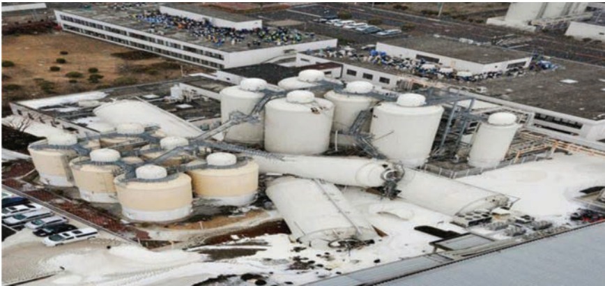
Землетрясение в Коста-Рики 1991 года ( M_w=7.8 ) вызвало опрокидывание баков и разлив опасной жидкости