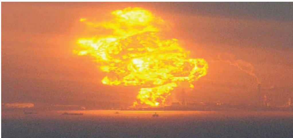
Горящие контейнеры с природным газом после землетрясения в префектуре Чиба.

Объекты нефтегазодобычи относят к опасным производственным объектам, которые в случае аварий представляют серьезную угрозу для человека и окружающей среды. Нефтехимические заводы – очень большие и сложные системы, которые включают километры трубопроводов, различного рода запорной арматуры и десятки типов баков для хранения и жидких и газообразных продуктов в широком диапазоне давлений и температур (включая криогенные). Обычно, баки для хранения жидких и газообразных продуктов нефтехимического производства – конструктивно простые и относительно недорогие объекты. Анализ последствий землетрясений показывает, что резервуары могут получать значительные повреждения. Несмотря на определенный прогресс, достигнутый в последние годы в данном сегменте производства, резервуары нефти и нефтепродуктов остаются одними из наиболее уязвимых для сейсмического воздействия.