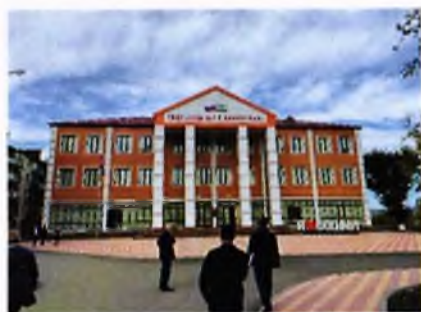
Школа на 320 мест в г. Карабулак

На 1 января 2022 года не проведена приемка завершающих работ по установке оборудования и внутренней отделке, не произведены расчеты с подрядной организацией.