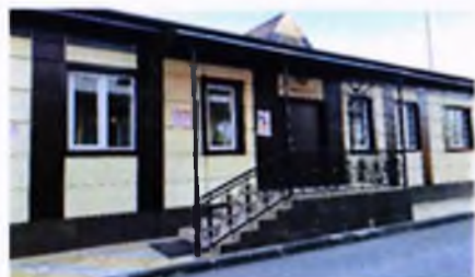
Врачебная амбулатория со стационаром в с.п. Троицкое

Предусмотренные в 2020–2022 годах средства составляют 4 193,7 млн рублей, или 54,2 % сметной стоимости строительства объектов (7 732,2 млн рублей).