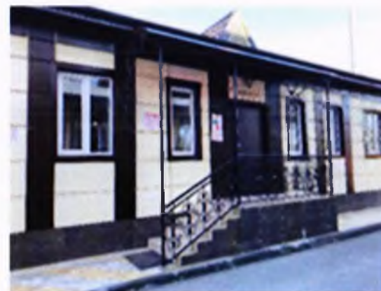
Врачебная амбулатория со стационаром в с.п. Троицкое