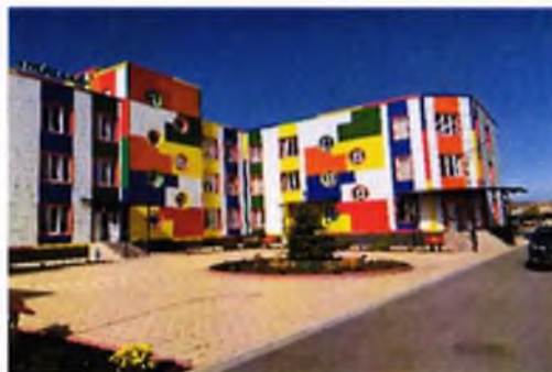
Детский сад на 220 мест в с.п Средние Ачалуки