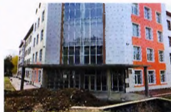
Поликлиника на 300 посещений в смену в г. Сунжа

! По указанным фактам – обращение в Генпрокуратуру РФ