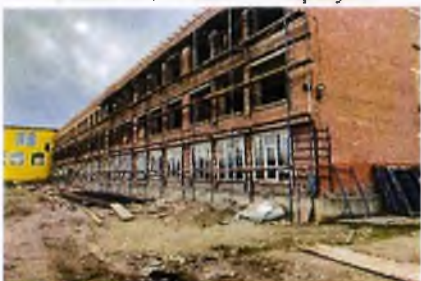
МОУ Средняя общеобразовательная школа № 3 г. Назрань

На 1 января 2022 года не проведена приемка завершающих работ по установке оборудования и внутренней отделке, не произведены расчеты с подрядной организацией.