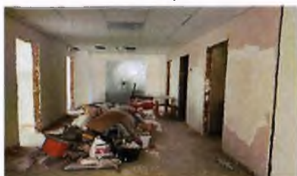
Поликлиника на 300 посещений в смену в г. Сунжа

На 1 января 2022 года не завершены работы по наружной и внутренней отделке пристраиваемого корпуса.