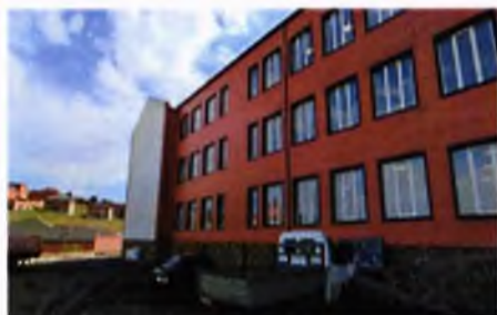
ГКОУ «Основная общеобразовательная школа с.п. Сурхахи»