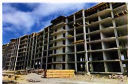
3 многоэтажных, многоквартирных жилых дома, г. Черкесск

Корректировка проектно-сметной документации в процессе строительства привела к необходимости проведения дополнительных работ и увеличению первоначально запланированных сроков завершения строительства.